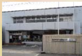
ショールーム 大阪タオル工業組合