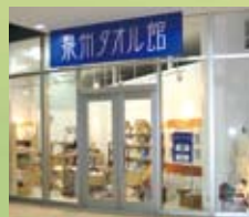
タオルショップ りんくうシークル店