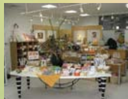
タオルショップ 泉佐野駅前店